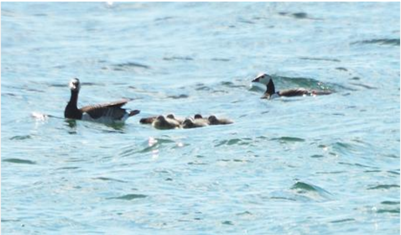
Bramgås, Hou Røn den 17. maj 2010.

I 2010 var jeg så heldig at være med på optælling på Hov Røn i forbindelse med Danmarks Miljøundersøgelses store projekt med optælling af kolonirugende fugle. I den forbindelse blev der på øen registreret et ynglepar af Bramgås med 7 middelstore gæslinger. Det bliver spændende, om arten vil bide sig fast her, og starte en ekspansion i det østjyske område, eller om der er en "enlig svale", som det er set flere andre steder i Danmark.