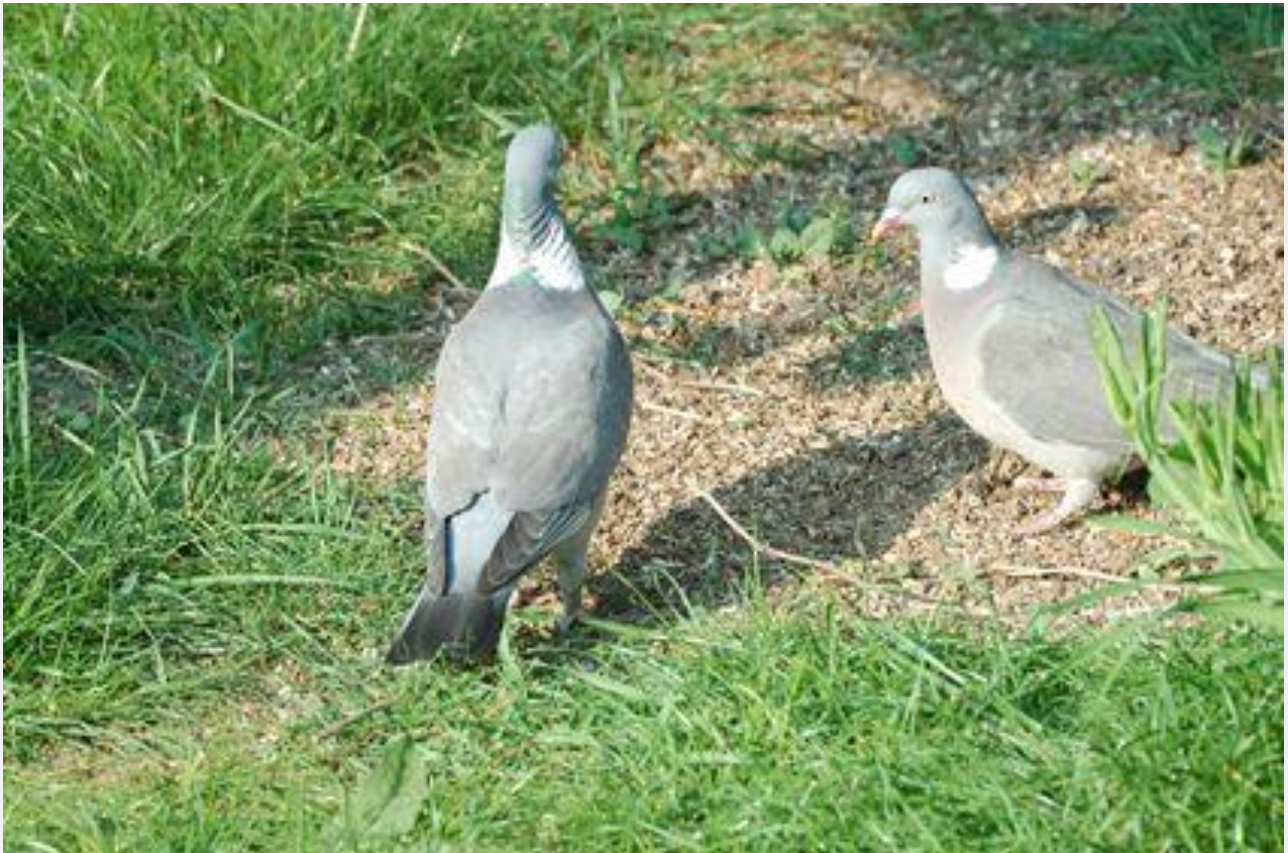
Ringduer ved foderplads.

Skrevet af Henning Etrup. Publiceret 25. april 2012