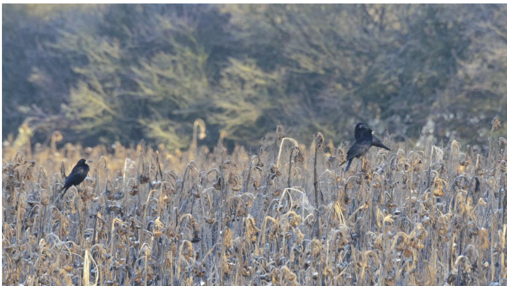
Råger i solsikker

Antallet af ynglepar/antal reder blev i 2021 optalt fra medio april til primo maj, og blev opgjort til mellem ca. 12.150 og ca. 12.500, eller omkring samme antal som i 1991 (Kahlert 1991). Fuglene fordeler sig på 135 kolonier, hvilket er en forøgelse i forhold til 1991, hvor der blev registreret 119. Kolonierne er således blevet mindre end dengang, nemlig omkring 91 reder mod 100 reder dengang. Optællingen viser samtidig, at rågekolonierne var koncentreret omkring de større byer, især i og omkring Aarhus. Men også i Randers, Grenå, Ebeltoft, Skanderborg, Odder og Silkeborg findes større kolonier (se figur 1).