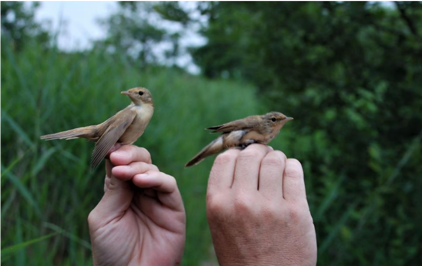
Kærsanger (venstre) og Rørsanger (højre)

Bl.a. blev detaljerne der afgør forskellen på Rør- og Kærsanger, samt Gran- og Løvsanger forklaret,