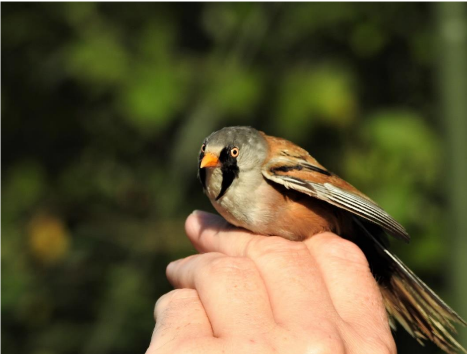
Skægmejse (gammel han)

ligesom vi var heldige at fange en flot Skægmejse. Der blev i alt fanget 18 fugle fordelt på 5 arter (Kærsanger, Rørsanger, Gransanger, Jernspurv samt Skægmejse). Så alt i alt en rigtig fin tur.