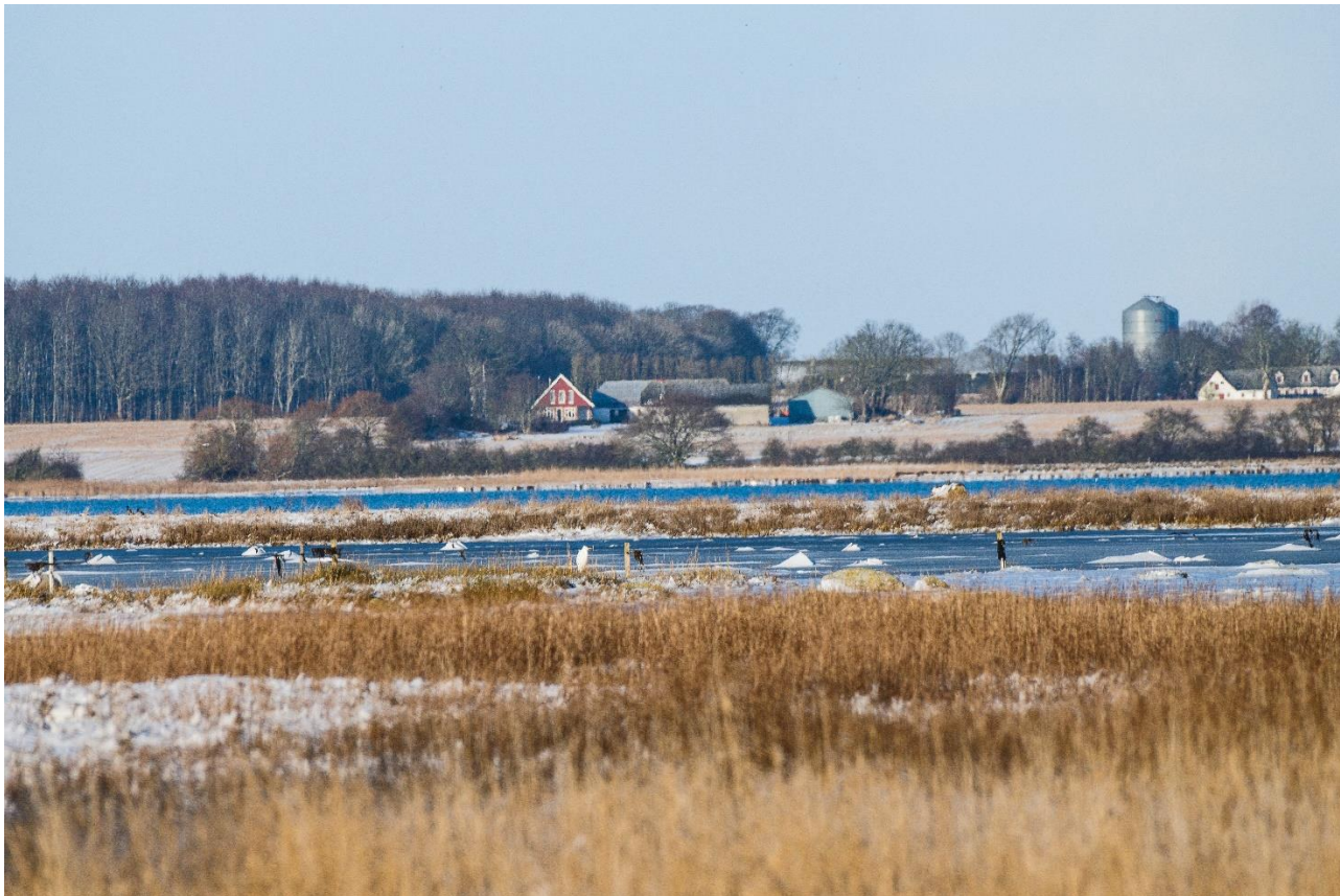
Udsigt til Sølvhejre fra Horskær.

Vi kørte nu videre over til østsiden af Lerdrup Bugt hvor vi gjorde holdt hvor Lindenæsvej går over i grusvej. Lerdrup Bugt var isdækket, hvilket naturligvis gjorde at der også her kun var få fugle, men selvfølgelig var der en del måger, sølvmåger og hættemåger samt en enkelt svartbag.