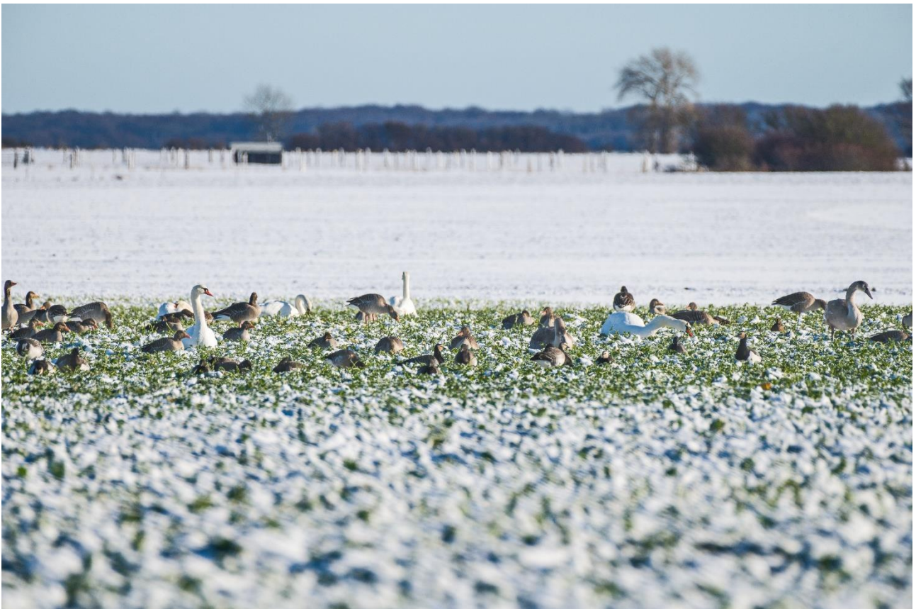
Knopsvaner, Grågæs og Bramgæs på Alrø.

Efter at have set det vi skulle gik det tilbage til bilerne for at køre retur mod østenden af øen. Første stop gjorde vi hvor vejen svinger væk fra fjorden, ved siden af den lille lagunesø. Også her var der storspover, hvinænder og strandskader. Desuden lå der nogle gravænder i området plus nogle krikænder, og inden længe var der en af deltagerne der spottede en lille flok snespurve inde på en mark. Medens vi nød disse kunne vi pludselig høre og se en stor flok gæs og svaner gå på vingerne længere fremme ad vejen, så nu skulle der ses efter havørn. Den dukkede da også kortvarigt op, og da roen igen havde lagt sig, blev der spottet en rovfugl siddende ude på marken i gang med at fortære sit bytte. Ved nærmere eftersyn viste det sig at være var en vandrefalk.