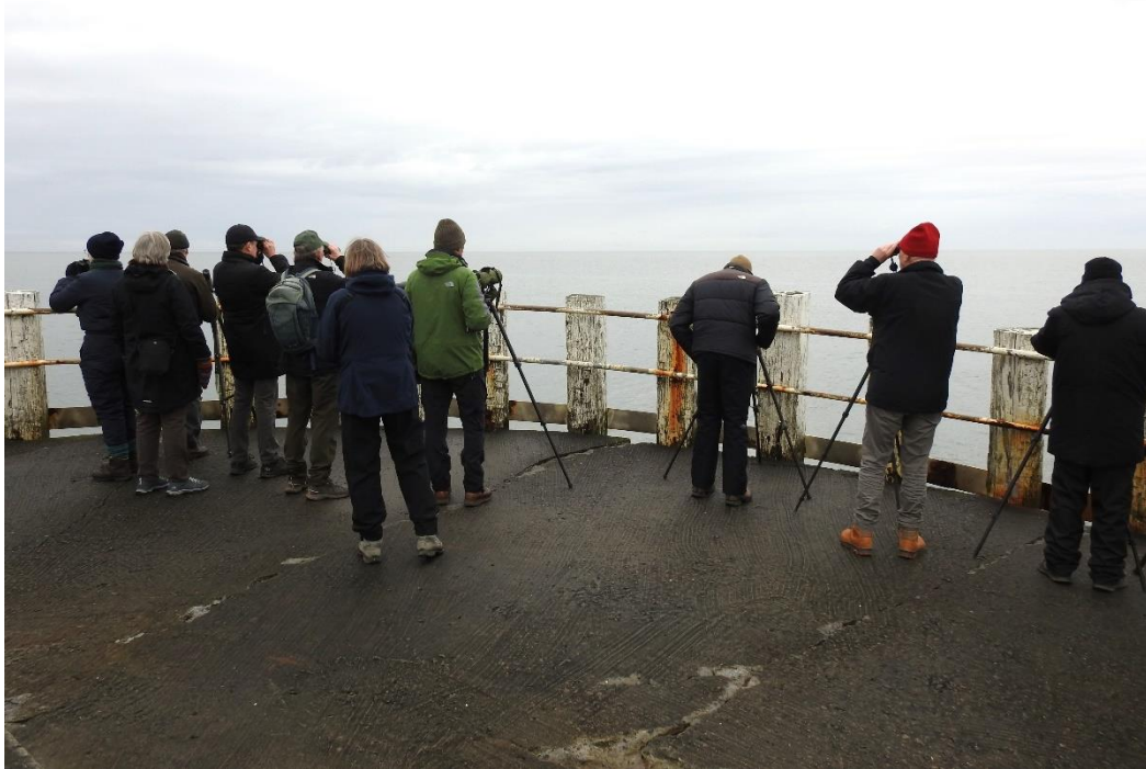
Der spejdes efter havlit og sule.

Artslisten kan opgøres til i alt 38 arter: almindelig ryle, bramgås, ederfugl, fiskehejre, fløjlsand, gransanger, gravand, gærdesmutte, gråand, gråkrage, gråspurv, havlit, husrødstjert, hvidklire, hvid vipstjert, hættemåge, knopsvane, musvåge, ringdue, rødben, rørspurv, sandløber, skarv, skovspurv, solsort, sortand, splitterne, stenpikker, stormmåge, stor præstekrave, strandskade, stormmåge, sule, svartbag, sølvmåge, toppet skallesluger, tornirisk og tårnfalk.