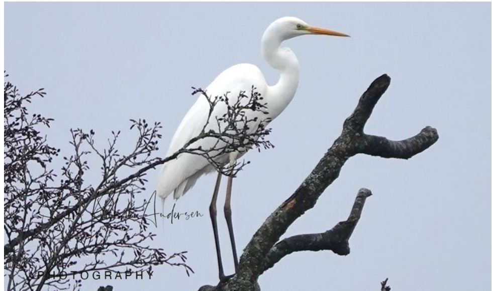
Sølvhejre.