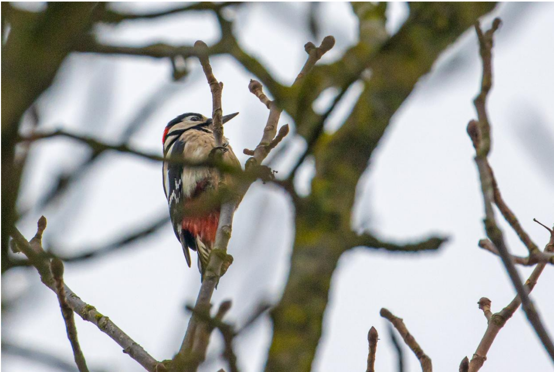
Stor Flagspætte.

Fra tårnet vendte vi tilbage mod naturcentret, og hvor det lige blev til en stor flagspætte inden vi gik indenfor til vores medbragte mad.