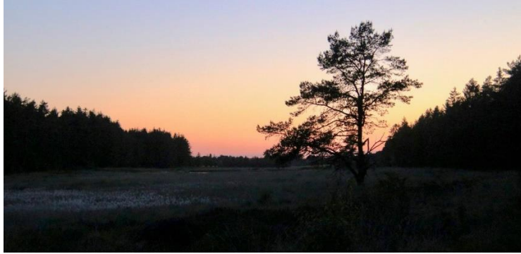
Solnedgang over Kompedal Plantage. Foto: Else Oltmann

Med denne snurren sluttede turen lidt i kl. 24.00, og artslisten blev følgende: Fiskehejre, Knopsvane, Sangsvane, Grågå, Gråand, Troidand, Rørhøg, Tårnfalk, Gøg, Natravn, Landsvale, Gærdesmutte, Bynkefugl, Sangdrossel, Tornsanger, Løvsanger, Gransanger, Musvit, Husskade, Gråkrage, Stær og Rådyr