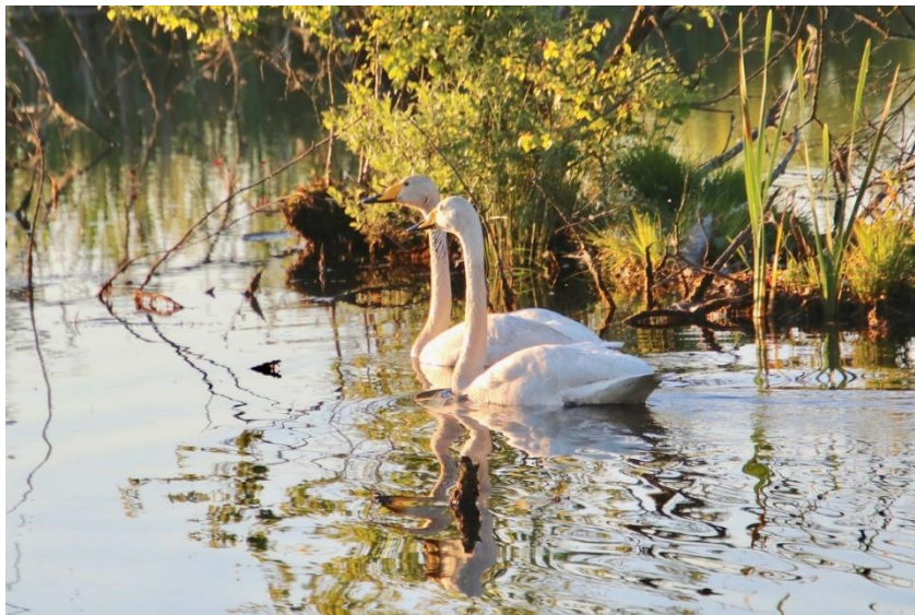
Sangsvaner.

Det var nu tid til at drage videre og på tilbageturen kunne vi igen beundre sangsvaneparret, nu lidt tættere på, og her hvor der var udsyn over engen på vestsiden, fik vi øje på to bynkefugle, som sad i noget af vegetationen.