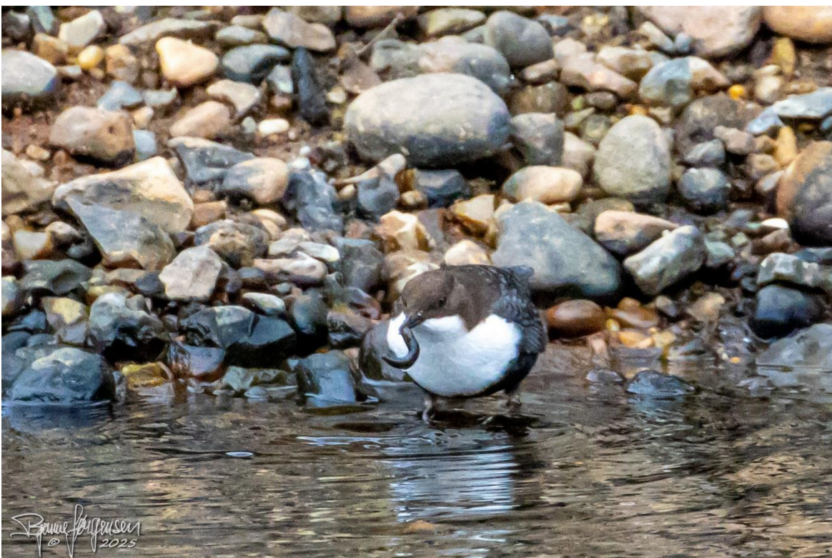
Vandstær med en godbid.

Henne ved udløbet at den oprindelige Gudenå var det blevet tid til at vende om, og vi valgte at lægge turen ned ad dæmningen til det lidt sumpede område langs åens gamle løb. Igen var der siskener og en enkelt gærdesmutte, og helt henne ved værket fik vi igen udsyn til vandstæren.