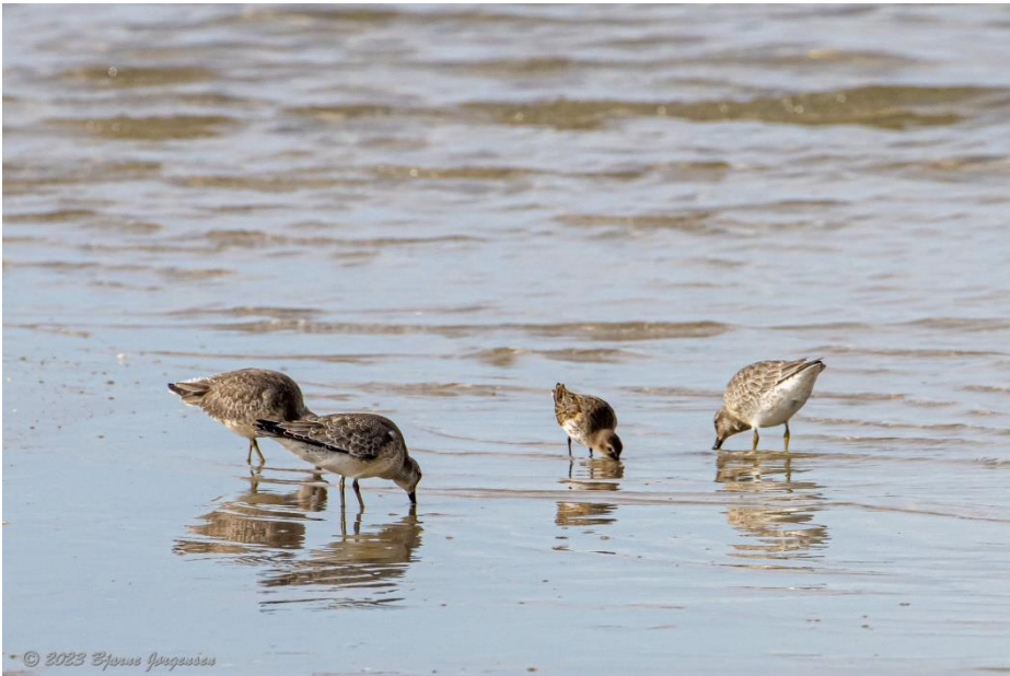
Islandske Rylere og Almindelig Ryle.

Havet syd for øer gav ikke mange fugle, nogle ederfugle blev det til og desuden kunne vi se en lille flok marsvin tumle sig nær kysten lidt længere ude. I baglandet var der rørspurv, og en tårnfalk havde vi også udsigt til.