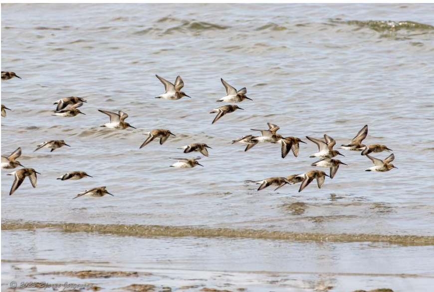
Almindelig Ryle.

Vejret artede sig fint, ja næsten perfekt med lunt vejr, ingen varmeklimmer, ingen regn og stort set vindstille.