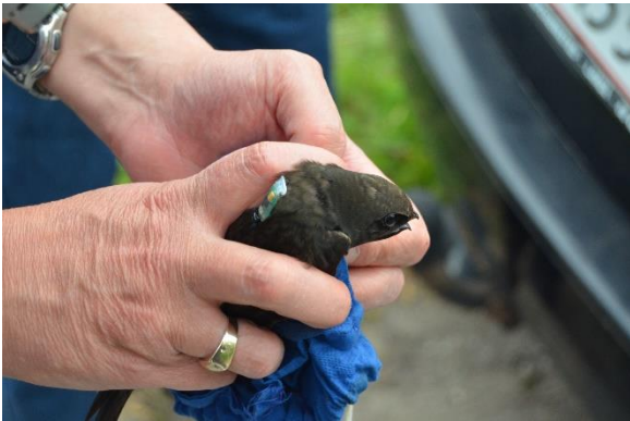
Mursejler med lyslogger på ryggen. Kortet viser 3 mursejleres træk fra Nyborg gennem Afrika i 2011-12. (data fra Statens Naturhistoriske Museum)