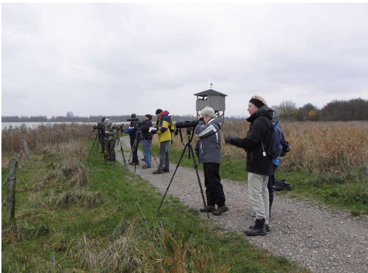
Gråkragerne ved Egå Engso.