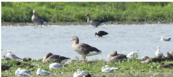
Sort ibis ved Egå Engso 22/8.

Fra sidst i september og året ud blev der næsten dagligt set nøddekrige i St. Hjøllund Plantage, og det antages at arten har ynglet i området. Som en sidegevinst blev der også set en del hvidvinget korsnæb i området, også de mistænkes for at have ynglet i det midtjyske. Rosinen i pølse-enden blev en silkehejre, der besluttede sig for at holde jul i Pederstrup på Djursland. Fuglen var dog "tam" idet ringmærker viste at den stammede fra en fuglepark i Tyskland.