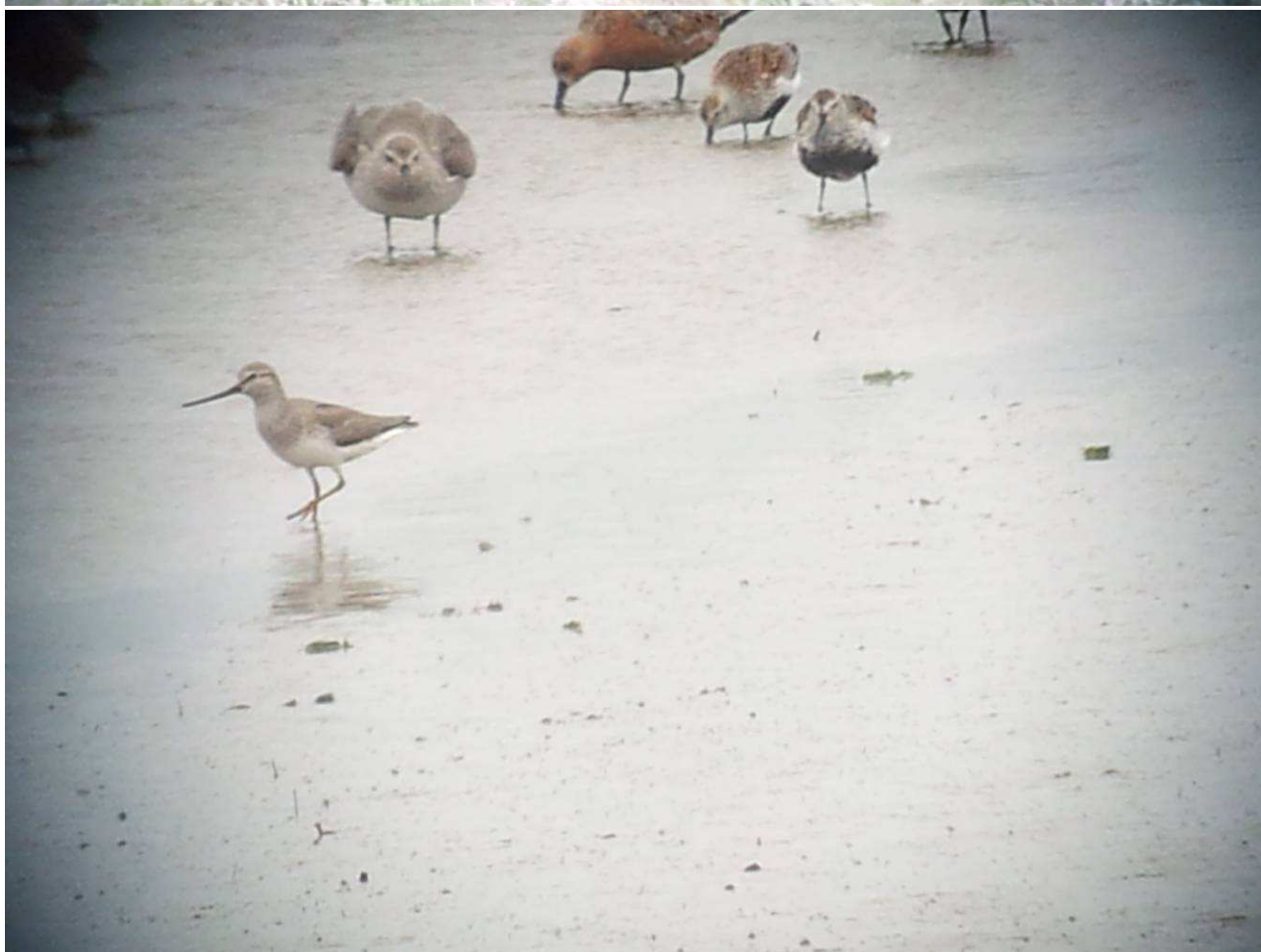
Rødhalsed gås (øverste billede) og terekklire, begge Margrethekog 10. maj 2014.