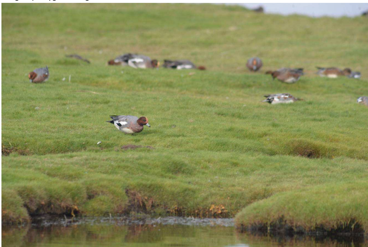
Pibeænder på Bygholmengen.