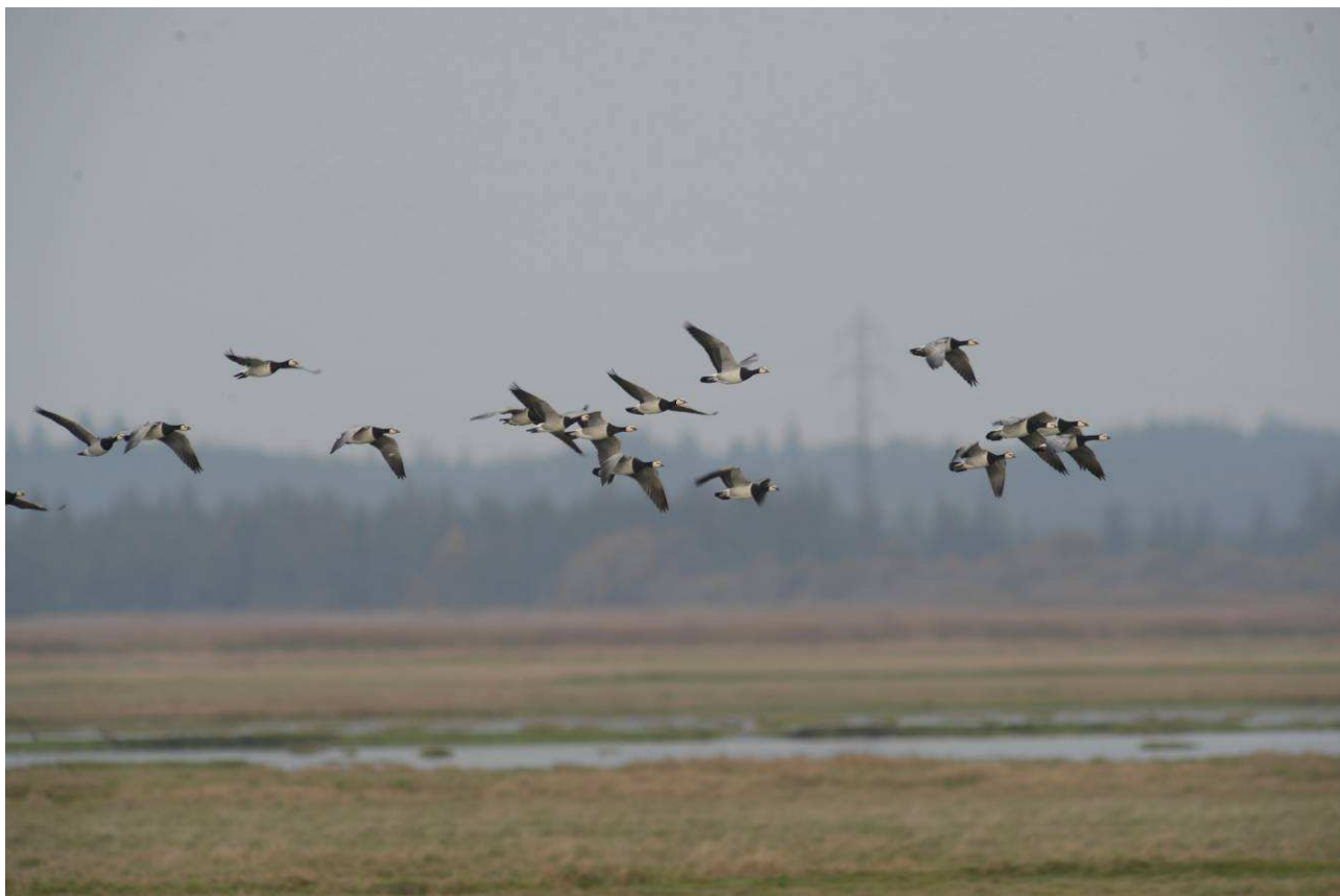
Grågæs på Bygholmengen.