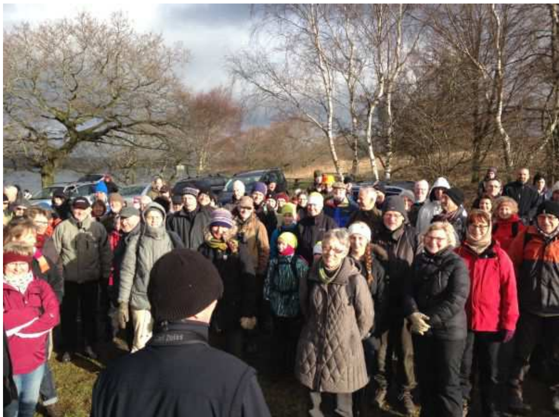
Ørnens Dag ved Vædebro, Mossø.

I år blev ørnens dag afholdt i Østenden af Mossø. Vejret var ikke med os da det blæste en del og var bidende koldt. Alligevel fik de ca. 200 fugleinteresserede en god oplevelse, da 2 havørne fløj hen over søen.