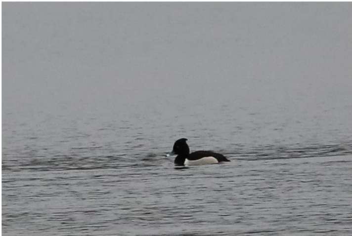
Halsbåndstroidand x Troldand (hybrid) Julsø 22/01/2022.