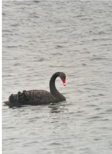
Sortsvane Kongensbro Råstofgrave 15/11/2022.

Kort over lokaliteter med indtastede observationer på DOFBasen i Silkeborg Kommune i 2022: