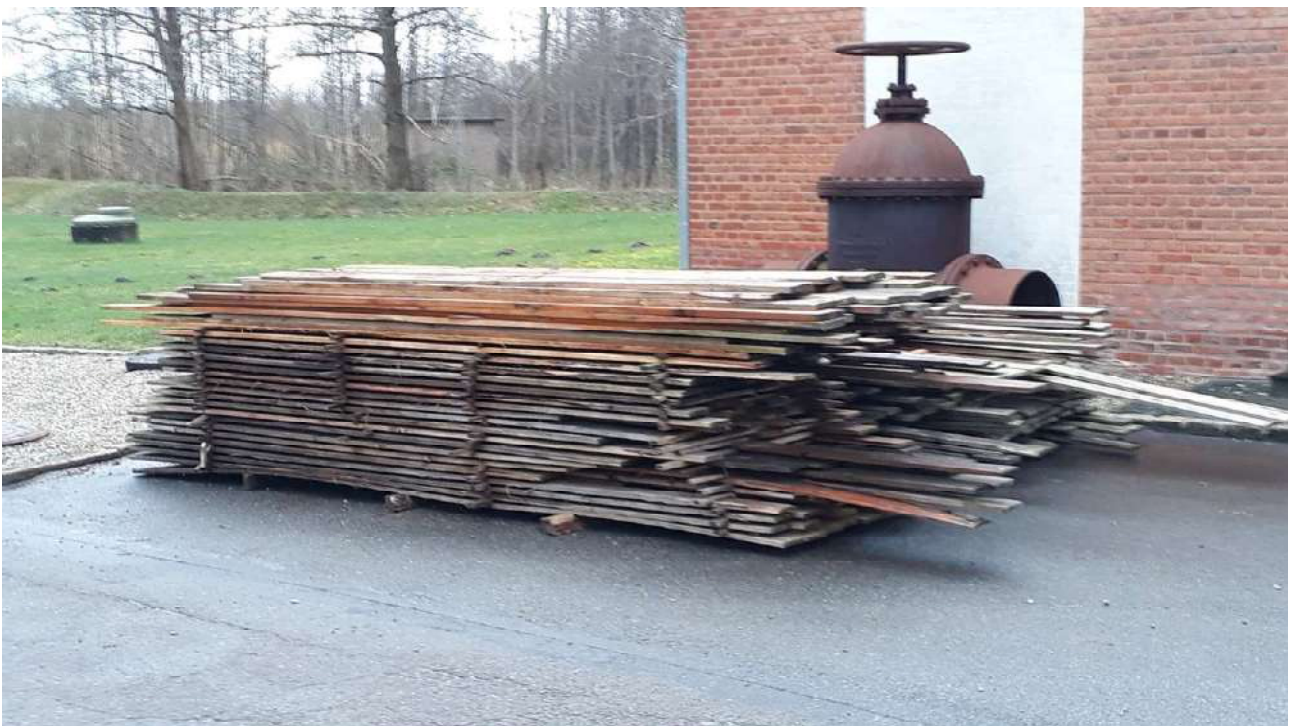
Foto. Brædder til etablering af gangbro.

Det gav resultat, så jeg hos Rodelund Savværk kunne købe omkring 1500 m brædder til projektet, som nu ligger på Stavtrup Vandværk, og venter på at blive skruet sammen, så de kan blive lagt ud, inden sæsonen starter 1. maj.