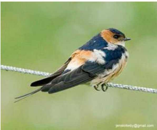
Rødrygget svale, Årlev Engsø 11.05.2007.

Blandt de mindre fornøjelige oplevelser fra 2007 hører afbrænding af vores "gamle" fugletårn ved Brabrand Sø d. 23. august. Tårnet blev i 1978 opført af DOF, med støtte fra kommunen. Også Aage V. Jensens Fondes tårne ved Vorup Enge har i løbet af året været udsat for ildspåsættelse og andet hærværk. Det er for at bruge et godt jysk udtryk rigtig "træls" at der findes personer i vores land, som ikke kan opføre sig ordenligt men skal ødelægge det for alle andre! Heldigvis har Århus Kommune handlet hurtigt og allerede nu er genopførelsen af tårnet i gang! Vi kan også trøste os med at vi i juli kunne indvie et nyt flot tårn ved Egå Engsø, det skete fredag d. 6. juli under stor festivitas. Frivillige fra lokalafdelingen samt Naturbutikken bemandede en fælles stand, som blev flittigt besøgt af de næsten 1000 gæster.