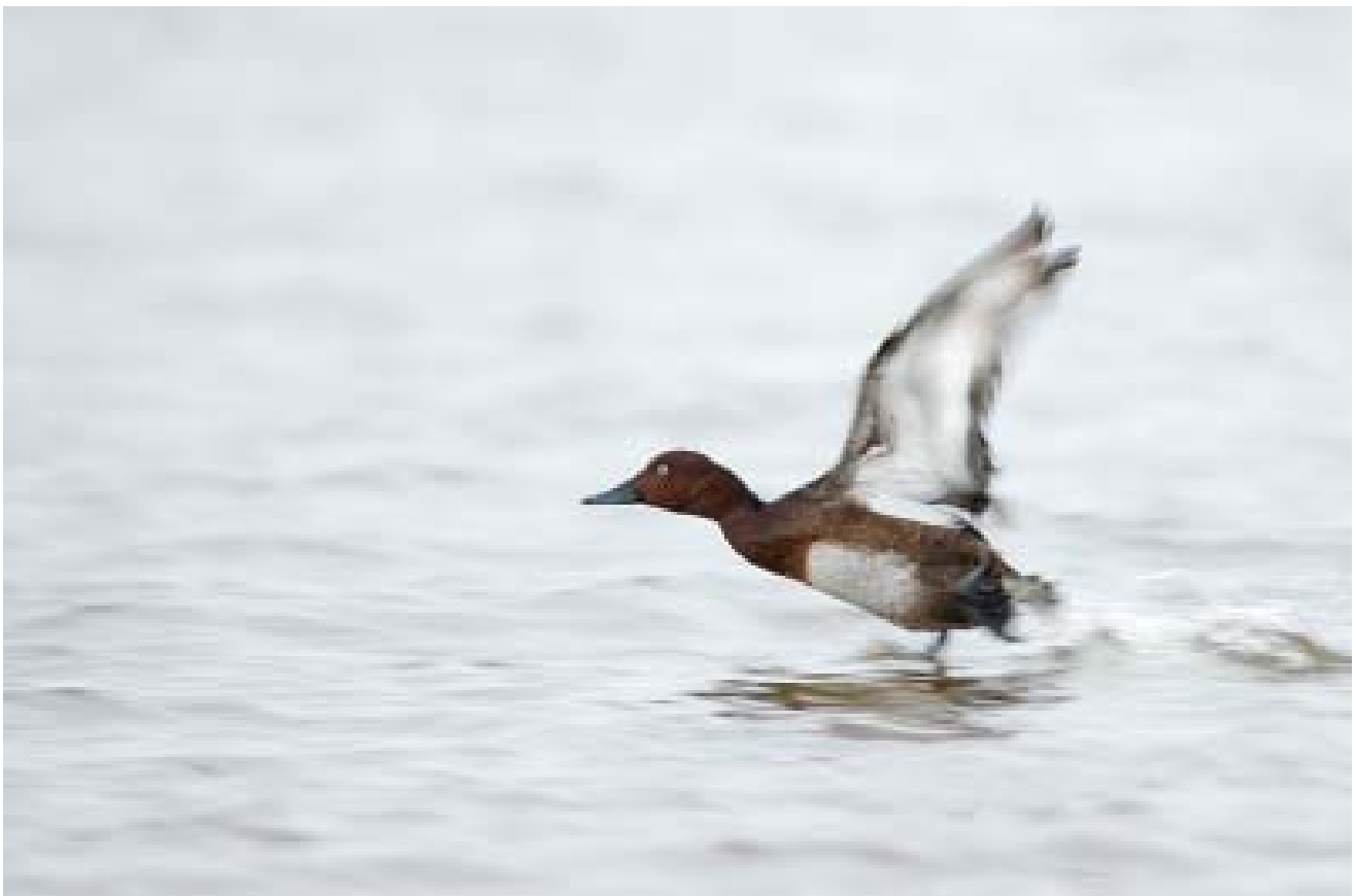
Hvidøjet and, Egå Engsø 08.11.2007.

*** for 2006 og 2007 er tallene pr. 31.12.