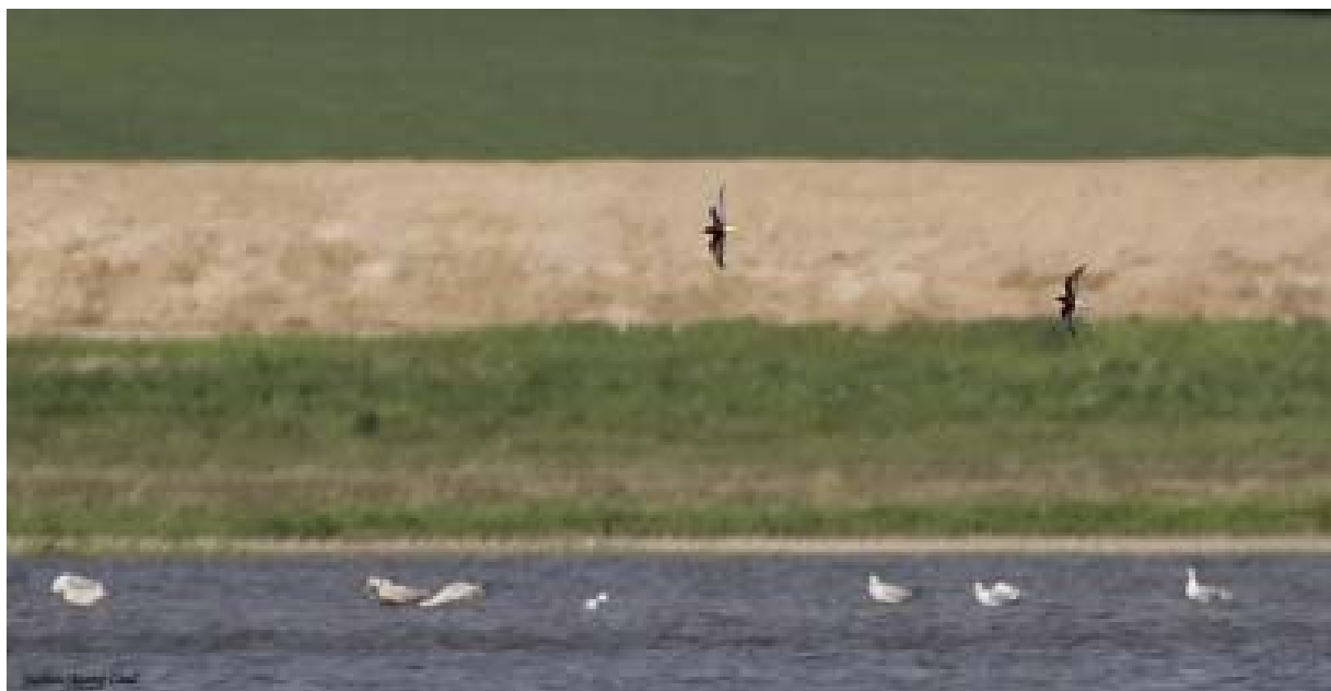
Hvidvinget terne, Egå Engsø 19.05.2007.

Bestyrelsen har ved næsten hvert møde drøftet stoftilgangen, og ved fælles brain-storm samt en opfordring i nr. 4 er der fortsat ideer på banen og stof på vej til kommende numre.