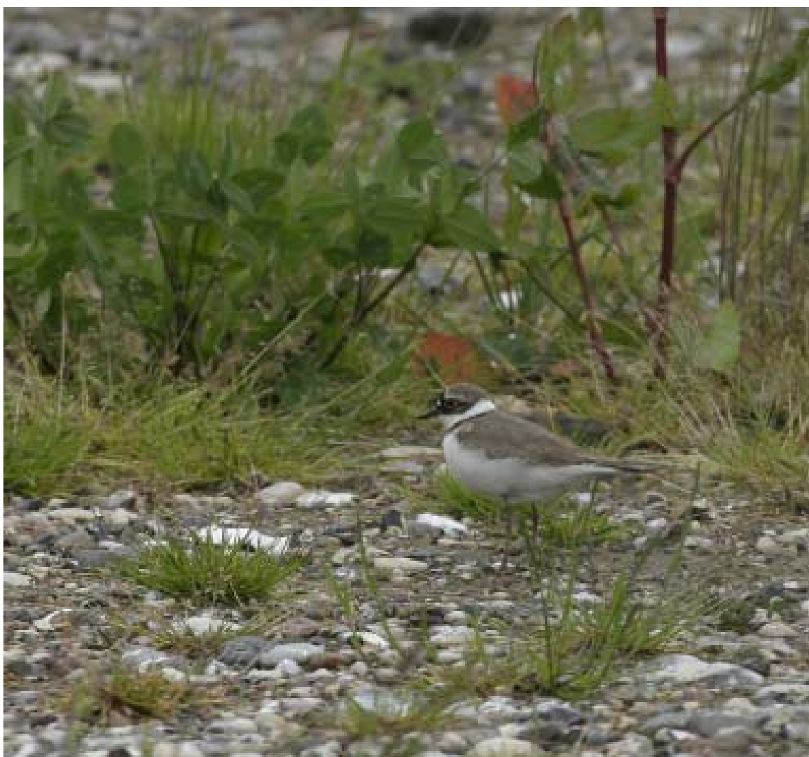
Lille Præstekrave.