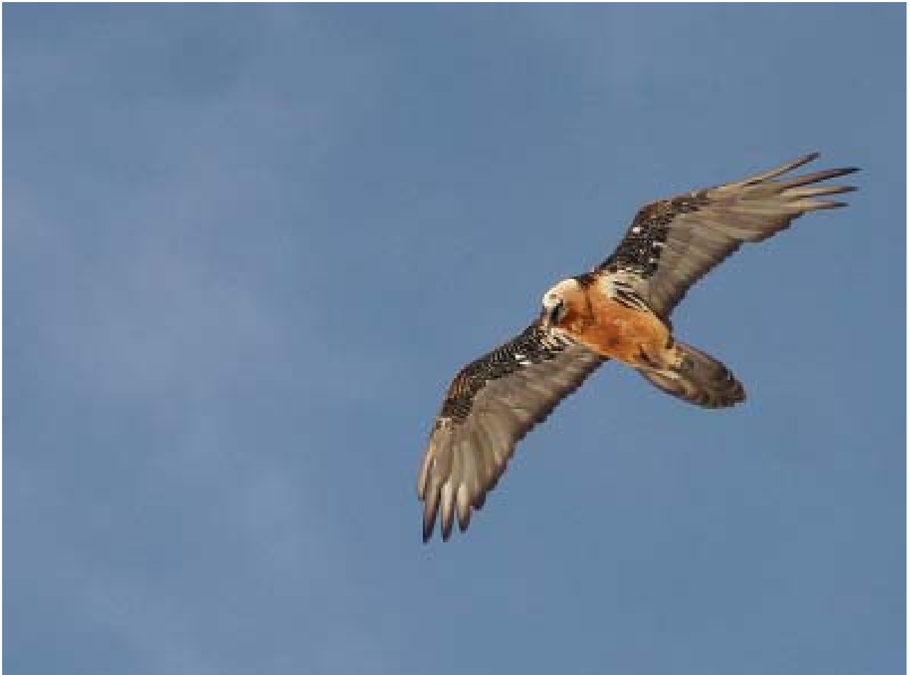
Adult Lammegrib.

gode venner, og så er der jo altid hyggelig stemning i sådan en bilfuld. Det, der gjorde turen speciel, var færgeoverfarten Spodsbjerg-Tårs. Første afgang meget tidligt om morgenen, og den stakkels pige i cafeteriaet syntes vist, at det var meget mærkeligt, at der pludseligt var 70-75 mennesker med kikkerter – og for at oplevelsen kan figurere blandt ”de gode”, skal det selvfølgelig med, at fuglen blev set!