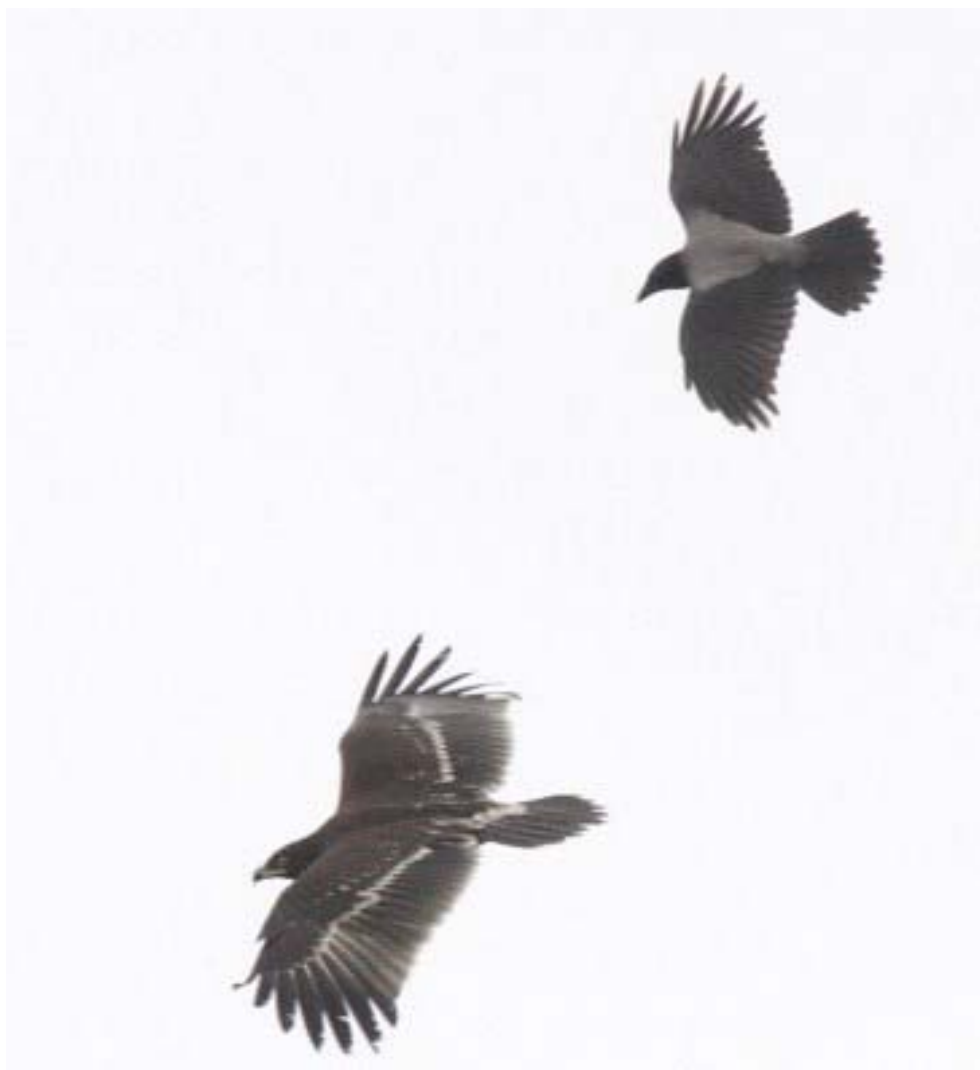
Stor skrigeørn (og krage), Hyllested Bjerge 11.03.2007.

2007 har budt på både gode og mindre gode oplevelser i fuglemarkerne. Blandt de gode og spændende oplevelser bør her nævnes Egå Engsø, der i sit første komplette leveår trådte i karakter som en perle blandt engsøerne. På DOFbasen er der meldt ikke mindre end 172 fuglearter/racer fra området i 2007, heriblandt adskillige sjældenheder hvoraf skal nævnes Plettet Mudderklire og Hvidvinget terne i maj samt Hvidøjet and i november, sidstnævnte blev set i området i mere end 14 dage af mange tilrejsende fuglekiggere. Blandt øvrige mindeværdige oplevelser fra 2007 kan nævnes en Stor skrigeørn der huserede - eller skal jeg skrive skulkede!? på Djursland igennem det meste af foråret, Rødrygget svale ved Årslev Engsø og ikke mindst Halsbåndstroidanden på Stubbe Sø, der var i området samtidig med den Hvidøjede and i Egå Engsø, der var mange der fik sig en "dubble" i den anledning!