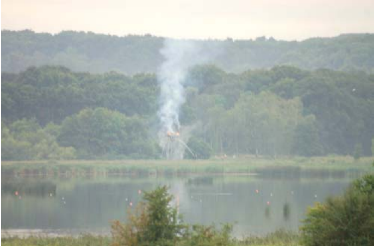
Fugletårnet ved Stautrup brænder 23.08.2007.

Blandt de mindre fornøjelige oplevelser fra 2007 hører afbrænding af vores "gamle" fugletårn ved Brabrand Sø d. 23. august. Tårnet blev i 1978 opført af DOF, med støtte fra kommunen. Også Aage V. Jensens Fondes tårne ved Vorup Enge har i løbet af året været udsat for ildspåsættelse og andet hærværk. Det er for at bruge et godt jysk udtryk rigtig "træls" at der findes personer i vores land, som ikke kan opføre sig ordenligt men skal ødelægge det for alle andre! Heldigvis har Århus Kommune handlet hurtigt og allerede nu er genopførelsen af tårnet i gang! Vi kan også trøste os med at vi i juli kunne indvie et nyt flot tårn ved Egå Engsø, det skete fredag d. 6. juli under stor festivitas. Frivillige fra lokalafdelingen samt Naturbutikken bemandede en fælles stand, som blev flittigt besøgt af de næsten 1000 gæster.