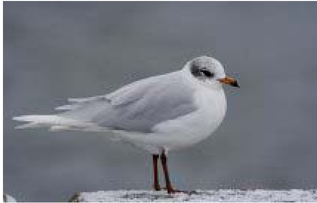
Sorthovedet Måge4K, Århus Havn 04-01-09.