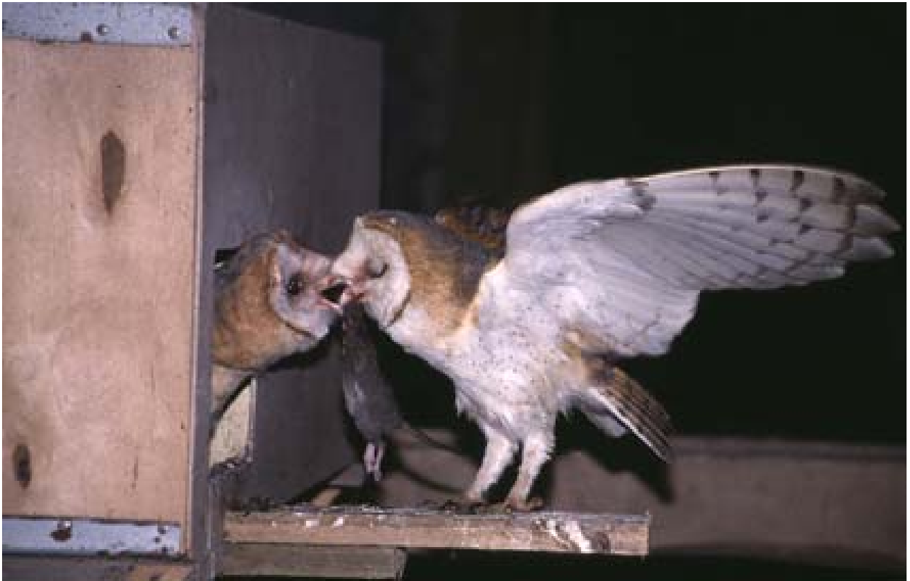
Den gamle Slørugle kommer med mad til de sultne unger. I dette tilfælde har den fanget en rotte. Foto: Klaus Dichmann. (Gengrug af foto fra Søravnen 2004 nr. 4).

Rotten betragtes af de fleste mennesker som et skadedyr på grund af dennes enestående evne til at gnave gennem hårde materialer. Rotten ødelægger for rigtig mange penge hvert år ved at gnave i alverdens ting i menneskets omgivelser som elkabler, kloakrør, isoleringsmateriale, mursten og træ. „Alt hvad der kan ridses med en kniv, kan rotter gnave i“. Rotten undersøger sine omgivelser og dermed fødeemner ved at bide i stort set alt, den møder på sin vej.