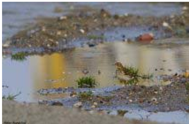
Bjergpiber, Østhavnen 30.11.08.

Hele 4800 Blishøns blev optalt 17/1 i Egå engsø. Koncentrationen af fugle på lokaliteten er virkelig overvældende, og jeg opfordrer hermed alle til at besøge stedet. To Traner er set 5/11 overflyvende ved Gudensø. Samsø kunne 27/1 mønstre hele 19 Sortgrå Ryler ved Bosserne. En meget sen Mudderklire blev set 4/12 ved Egå Engsø, og 8/1 blev en Svaleklire set ved Salten Å og ådal Them. Kalø Slotshalvø har tidligere været rigtig god til sene forekomster af klirer, denne gang er en Sortklire blevet set 23/11 og 21/12. Yderligere to fugle er set 23/12 ved Alrø Eghoved. Eneste registrerede kjo ve i perioden er en Stor Kjo ve fra 17/11 Fornæs. En meget populær Sorthovedet Måge 4K på Århus havn er et tilbagevendende individ. Fuglen er meget samarbejdsvillig og stedfast, så hvis du endnu ikke har set denne dejlige fugl, er det bare om at komme af sted! Det kan eventuelt kombineres med en indkøbstur, da fuglen har en forkærlighed for pølsebrød ved Bispetorv. Vinter- Sildemåger er sjældne, så alder og omstændigheder skal derfor helst beskrives. Jeg vil dog nævne en fugl fra 13/12 Kvindsø, da den virker pålidelig, også selvom fuglen mangler alder. Århus Østhavn plejer at være god til Kaspiske og Middelhavssølvmåger, men har denne vinter skuffet en del. Eneste dokumenterede fund er 28/11 1K Middelhavs-sølvmåge . Ungfugle er ellers sjældne på disse kanter! Fem sene Splittern er set ved henholdsvis: 3/11 1 rst Issehoved, 10/11 1 trk Fornæs, 12/11 2 SV Issehoved og 15/11 1 Bønnerup Strand.