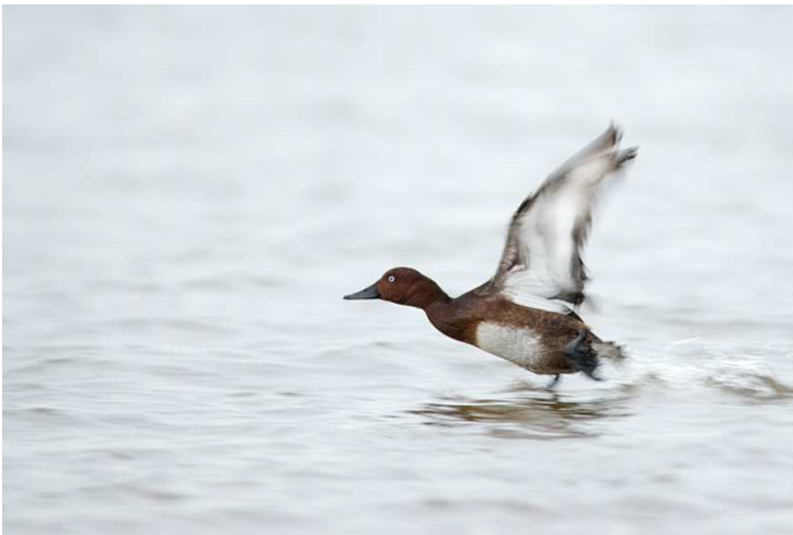
Hvidøjet and, Egå Eng sø 08.11.2007.

Blandt de mindre fornøjelige oplevelser fra 2007 hører afbrænding af vores ”gamle” fugletårn ved Brabrand Sø d. 23. august. Tårnet blev i 1978 opført af DOF, med støtte fra kommunen. Også Aage V. Jensens Fondes tårne ved Vorup Enge har i løbet af året været udsat for ildspåsættelse og andet hærværk. Det er for at bruge et godt jysk udtryk rigtig ”træls” at der findes personer i vores land, som ikke kan opføre sig ordenligt men skal ødelægge det for alle andre! Heldigvis har Århus Kommune handlet hurtigt og allerede nu er genopførelsen af tårnet i gang! Vi kan også trøste os med at vi i juli kunne indvie et nyt flot tårn ved Egå Eng sø, det skete fredag d. 6. juli under stor festivitas. Frivillige fra lokalafdelingen samt Naturbutikken bemandede en fælles stand, som blev flittigt besøgt af de næsten 1000 gæster.