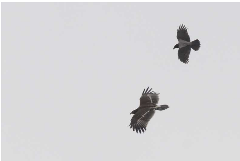
Stor skrigeørn (og krage), Hyllested Bjerge 11.03.2007.

2007 har budt på både gode og mindre gode oplevelser i fuglemarkerne. Blandt de gode og spændende oplevelser bør her nævnes Egå Engsø, der i sit første komplette leveår trådte i karakter som en perle blandt engsøerne. På DOFbasen er der meldt ikke mindre end 172 fuglearter/racer fra området i 2007, heriblandt adskillige sjældenheder hvoraf skal nævnes Plettet Mudderklire og Hvidvinget terne i maj samt Hvidøjjet and i november, sidstnævnte blev set i området i mere end 14 dage af mange tilrejsende fuglekiggere. Blandt øvrige mindeværdige oplevelser fra 2007 kan nævnes en Stor skrigeørn der huserede - eller skal jeg skrive skulkede !? på Djursland igennem det meste af foråret, Rødrygget svale ved Årslev Engsø og ikke mindst Halsbåndstroidanden på Stubbe Sø, der var i området samtidig med den Hvidøjjede and i Egå Engsø, der var mange der fik sig en "dubble" i den anledning!