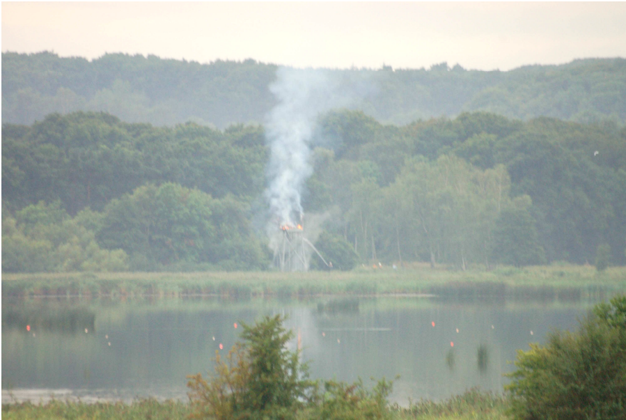
Fugletårnet ved Stautrup brænder 23.08.2007.