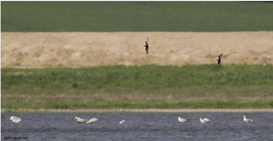
Hvidvinget terne, Egå Eng sø 19.05.2007.