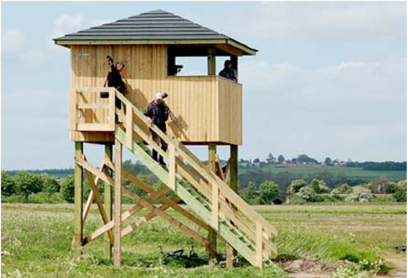
Det nye fugletårn ved Egå Eng sø, juli 2007.

Fredag d. 6. juli var der fest og flag ved Egå Eng sø. Den dag blev fugletårnet ved Egå Eng sø indviet.