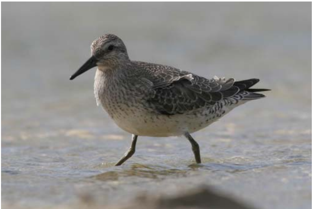
Islandsk ryle.