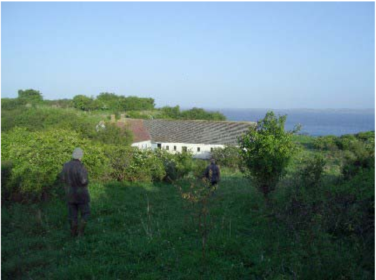
Højgården på Hjelm.

Resultaterne af optællinger kan ses på www.dofbasen.dk/IBA/lokalitet.php?lokid=112 Hvor du skal slå op under status 2007.