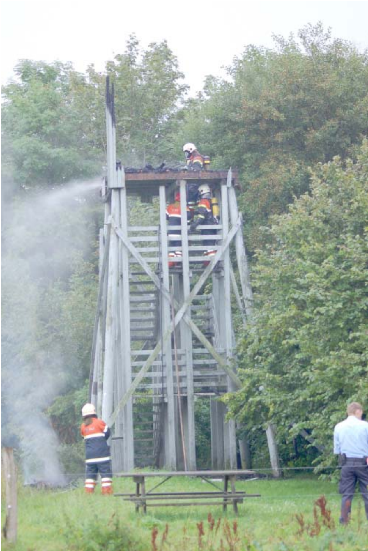
Et trist syn – de sørgelige rester af fugletårnet ved Brabrand Sø d. 23.08.2007.