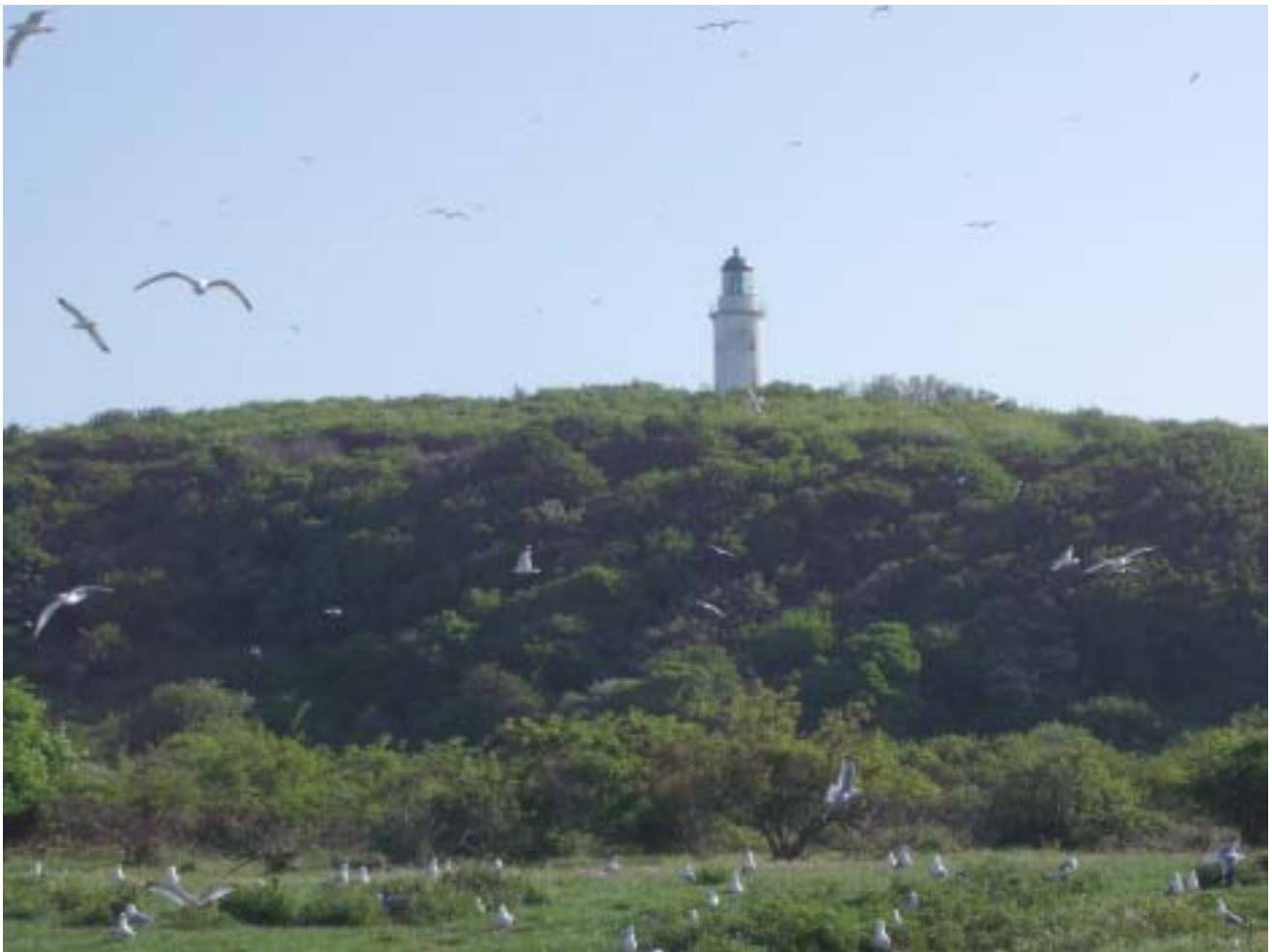
Mågekoloni på Hjelm med fyret i baggrunden.

Formiddagen gik med optælling af strandene og kysterne på Vesthagen. Det var et stort område, der skulle tælles op. Det skulle foregå hurtigt og med stor forsigtighed, af hensyn til ynglefuglene. På en del af området