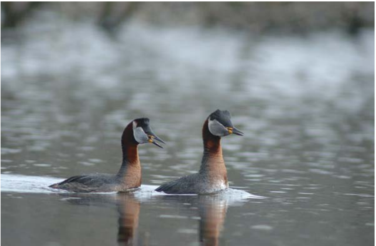
Gråstrubet lappedykker.