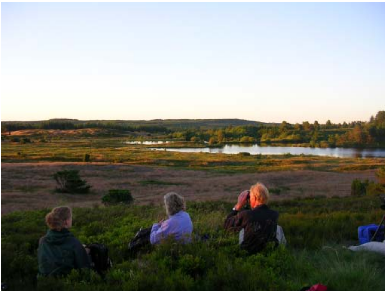
Vrads Sande er en del af Natura2000-område nr. 53, og dermed et af de områder, som skal have en naturplan.