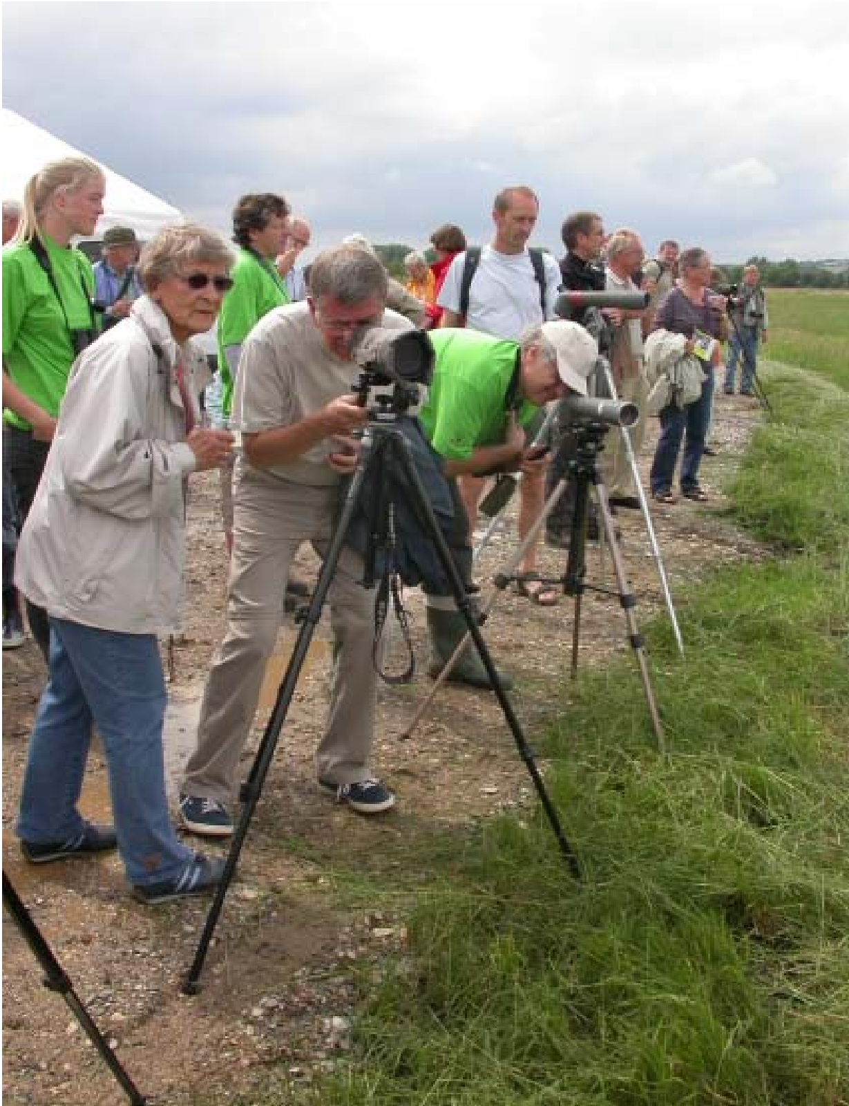
Fuglene vises frem for de besøgende ved Egå Eng sø.

Tårnet, der er bygget efter de samme tegninger som det gamle Århus amts tårne (fx træstårnet ved Årslev Eng sø og Sminge sø) er betalt af det australske vinfirma Banrock Station. På dagen blev der holdt taler af bl.a. direktør Tony Sharley fra Banrock Station, og både DOF og DN var repræsenteret med stande, hvor de besøgende kunne få mere at vide om foreningerne, og fuglene ved søen. En række frivillige DOF'ere stillede op med deres scoper og fortalte om de fugle, man kunne se. Der var fx fine sorthalsede lappedykkere med unger lige ud for tårnet. Naturbutikken var også til stede med en flot stand medbringende masser af bøger og kikkerter, der blev ivrigt studeret af de besøgende.