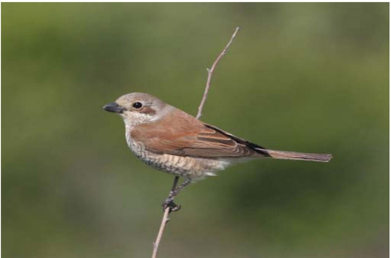
Rødrygget tornskade.