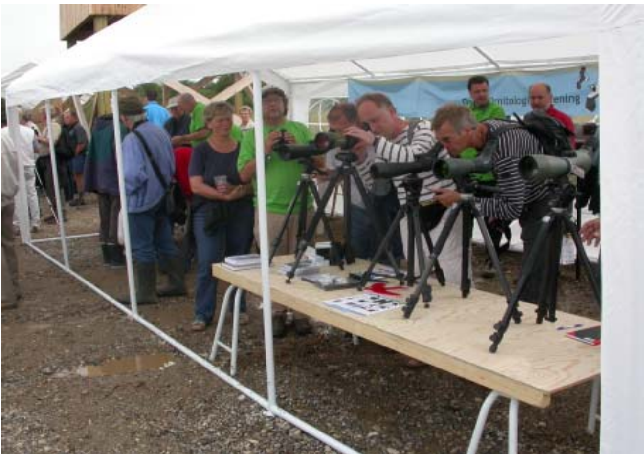
Mange besøgte DOF/Naturbutikkens stand ved engsøen.

Tirsdag d. 23. august tidligt om morgenen brændte Østjyllands ældste fugletårn, tårnet ved sydsiden af Brabrand Sø. Tårnet blev opført i 1981 i et samarbejde mellem Århus Kommune og DOF. Tårnet har flere gange været udsat for hævværk i større eller mindre omfang, men aldrig så grelt som denne gang. I skrivende stund er det uvist, om tårnet genopføres, men lokalafdelingen vil selvfølgelig kontakte Århus Kommune herom.